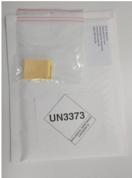
Voorbeeld verpakking paraffineblok

Objectglasjes worden op zich al beschouwd als primaire verpakking. Glasjes dienen verpakt te worden in een plastic doosje en vervolgens in een omslag. Op de omslag dient het merkteken UN3373 aangebracht te worden en de verwoording 'biologische stof, categorie B'.